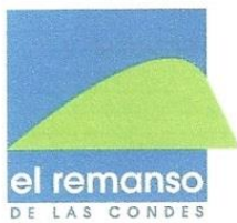
Imagen (1) Condominio Vistas del Remanso