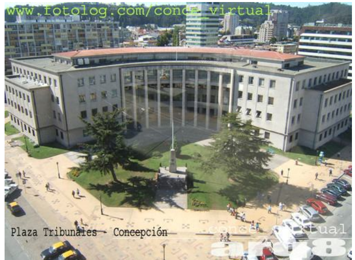
Edificio y Plaza de los Tribunales de Justicia. Obra que se debe a la reconstrucción posterior al terremoto de 1939 en Concepción.