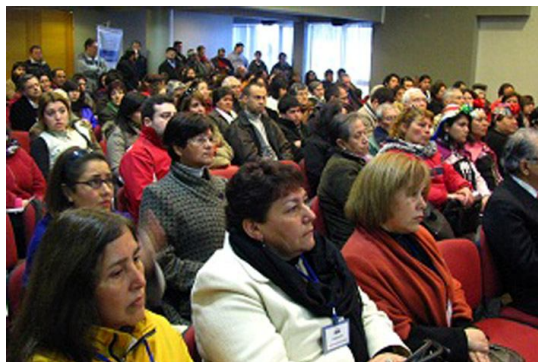
Asistentes al Primer Cabildo Ciudadano en Talca.

“Cerca de 300 ciudadanos inauguraron esta mañana en la Universidad Autónoma sede Talca, el Primer Cabildo Ciudadano; proceso que comenzó con la instauración de su asamblea, el pasado 12 de junio, cuando más de 50 organizaciones se reunieron para poner la primera piedra al Movimiento “Talca con Todos y Todas”. (5)