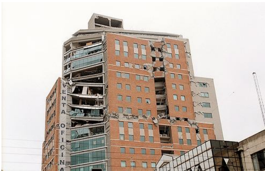
Torre O,Higgins. Concepción. Calle O'Higgins 241. Fotografía Plataforma Urbana.

Así tituló la prensa durante el fin de semana, una información oficial de su gobierno. Se añadió que por primera vez después del terremoto ocurrido el 27 de Febrero, un grupo de expertos a bordo del canastillo de una grúa de 90 metros, inspeccionó los daños originados en la Torre O.Higgins,