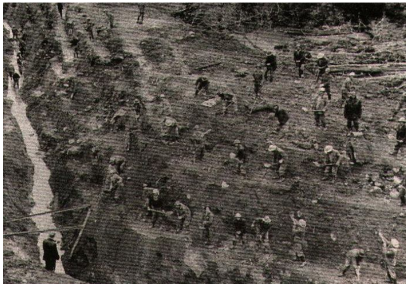
Terremoto de Valdivia en 1960. Miles de trabajadores civiles y voluntarios trabajaron en reencauzar el desagüe del Lago Riñihue.

Durante el gobierno de Salvador Allende tuvo lugar un terremoto el 8 de Julio de 1971, que asoló la región comprendida entre Ovalle y San Antonio, afectando el área más densamente poblada del país. Es el primer sismo enfrentado preferentemente por el Ministerio de la Vivienda que se había creado en 1965, y sus Corporaciones asumieron el desafío con tal eficiencia, que sólo cuatro meses más tarde, se dio a conocer el Plan completo de Reconstrucción, especificando en cada localidad de las zonas afectadas, el tipo y cantidad de viviendas a construir,