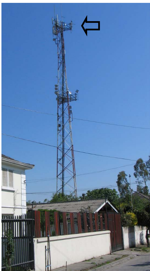
Noviembre, 2005 (flecha indica instalación original).

Grupo de Vecinos Calle Tres Oriente de la Comuna de Cerrillos Santiago, octubre 2007